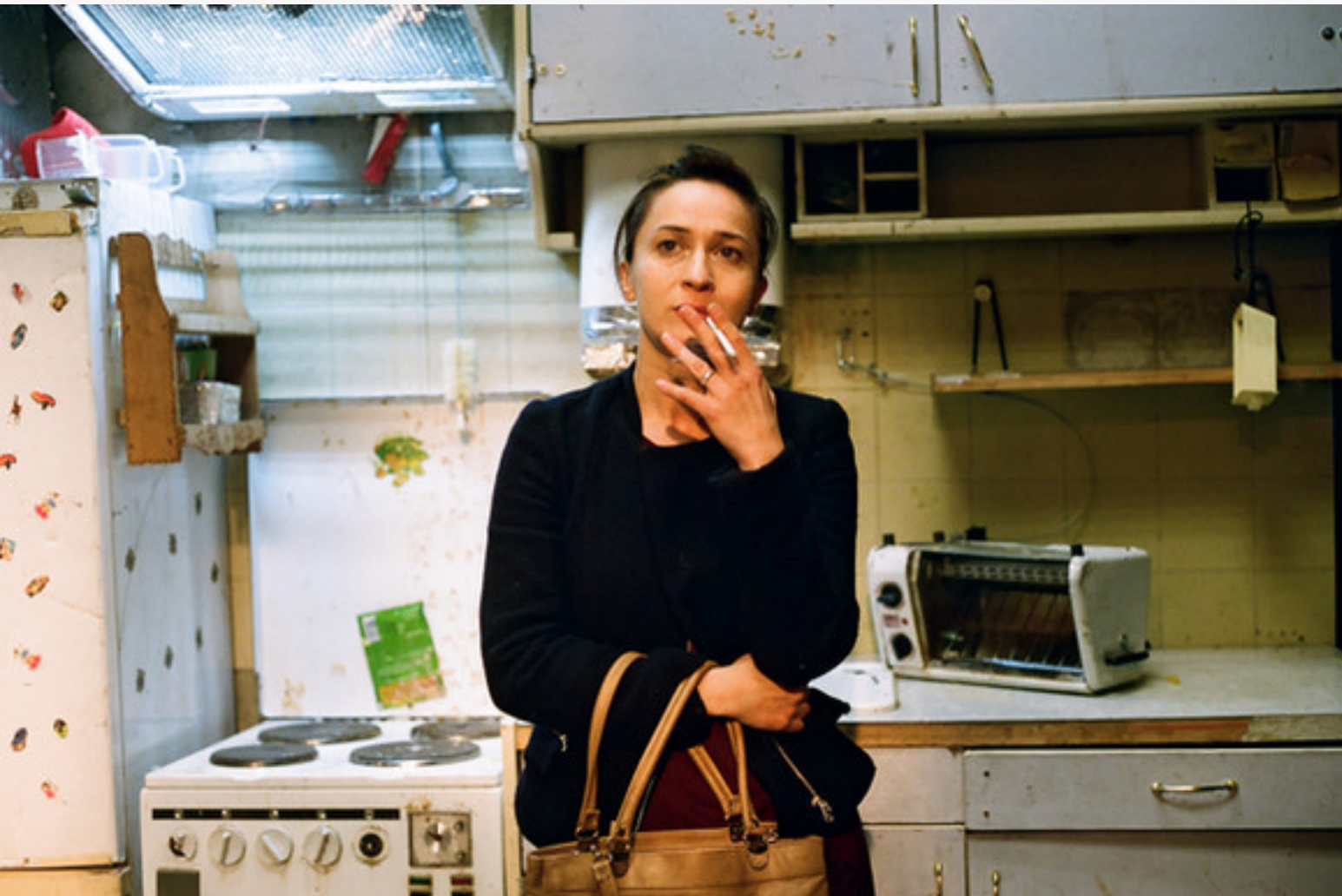
'Imitation of Life'